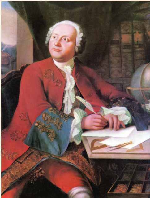
Михаил Васильевич ЛОМОНОСОВ (1711-1765)